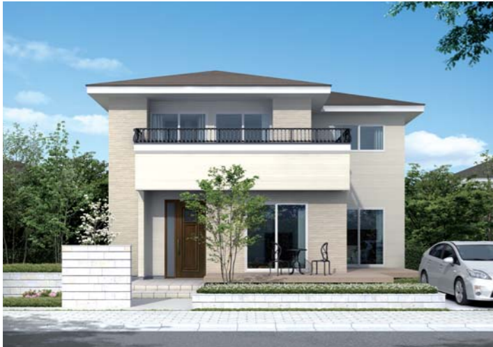
● つむぎえシリーズ