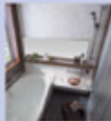
リフォーム バスルーム