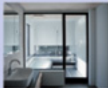
リクス バスルーム