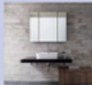
リクス ドレッシング ラシス