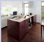
リフォーム キッチン